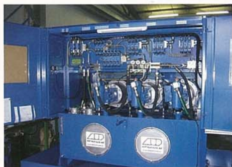
Hydraulikaggregat für Müllverbrennungsanlage