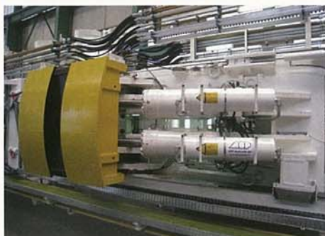
Rückfallsicherung für TBM