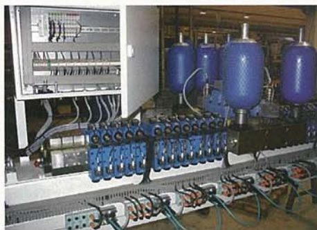
Ventilbalken mit Speicher und integriertem Klemmkasten für Gitterschweißmaschinen