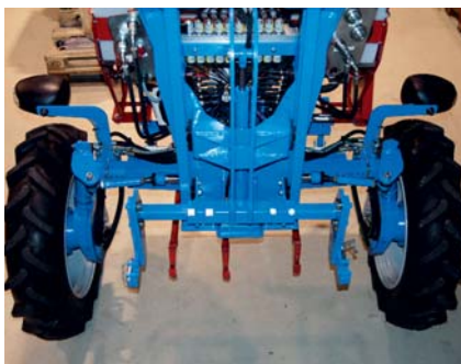
Hydraulischer Vorderradantrieb mit Front- und Zwischenachs-Geräteträger

Der Geräteträger ist für die professionelle Pflege aller Art von Kulturen ein absoluter Allrounder. Im Front-, Heck- und Zwischenachs-Vertikalhubwerk können problemlos Geräte zum Hacken, Bürsten, Striegeln und Häufeln angebracht werden. Düngestreuer, Säegeräte, Folienleger, Ernteplattformen können mit Leichtigkeit angebracht werden. Das Überkopfrahmen-Konzept vereint