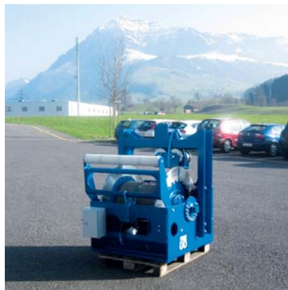
Seilwinde für den Tunnelbau

Die Windenproduktion ist für uns zu einem wichtigen Standbein geworden.