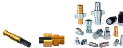
Schläuche und Kupplungen