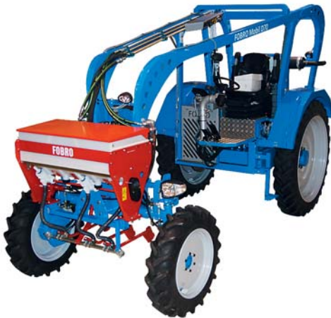
Das FOBRO Mobil

Die Schweizer Firma Baertschi entwickelt und produziert Maschinen für die Perma-Agrartechnik. Der Fokus von Baertschi liegt auf Maschinen für Sonderkulturen, die beispielsweise dem Gemüsebau, Baumschulen, dem Weinbau oder Erzeugern von Beeren, Kräutern etc. Effizienzgewinne beschieren. Mit diesen Maschinen können Arbeitsgänge und Kosten gespart werden. Bei der Planung und Umsetzung wird darauf geachtet, dass die Böden schonend bearbeitet und der Wasserverbrauch und der CO 2 -Ausstoss reduziert werden kann.