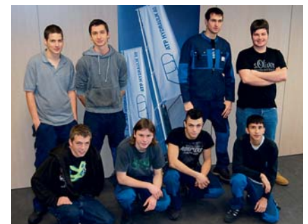
Die Lernenden der ATP-Hydraulik AG