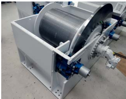
Seilwinde für Krananlage

Konnten wir uns vor einigen Jahren mit dem hydraulischen- oder hydrostatischen Antrieb befassen, setzen wir uns seit rund sechs Jahren mit dem gesamten Hebesystem auseinander.