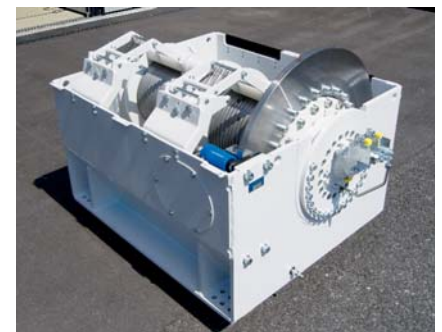
Doppelseilwinde für Schiffsentlader

Heute können wir Winden mit einer Zugkraft von 5000 N bis 200 000 N anbieten, die mit einer Leistung von 5 kW bis 200 kW angetrieben werden.