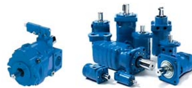
Pumpen und Motoren

Wir bieten Ihnen als Distributor-Partner das komplette Sortiment zu vorteilhaften Preis- und Lieferkonditionen an.