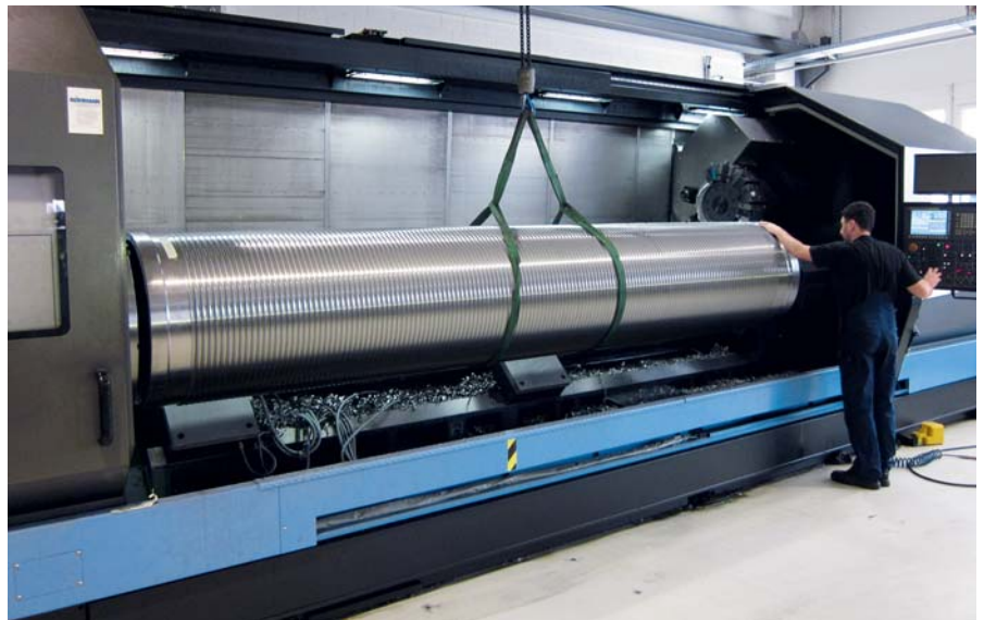
Windentrommel von 5m Länge auf unserer neuen Maschine Doosan Puma 700

Ein Hauptkomponent von jeder Winde ist die Seiltrommel. Dieser Teil