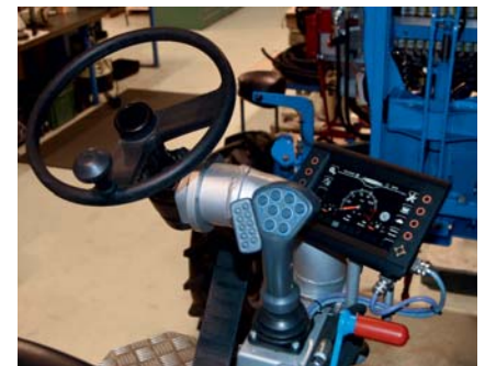
Cockpit mit Joystick und Display

Der hydrostatische Zapfenwellen-Antrieb, kann je nach Anwendung elektronisch stufenlos verstellt werden. Die Leistung, die von diesem Antrieb bezogen werden kann, wird vom Fahrer elektronisch bestimmt. Es besteht die Möglichkeit, dass der Zapfenwellenantrieb in Abhängigkeit mit dem Vortrieb automatisch geregelt wird. Mit zwei kompakten elektrischen Ventilblöcken können zehn verschiedene Funktionen betätigt und ausgeführt werden. Die gesamte Fahrzeugsteuerung übernimmt eine 16 Bit ifm Mobilsteuerung.